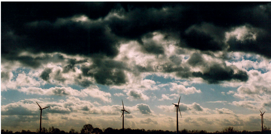
Für Energiewende und Grüne Wirtschaft ziehen dunkle Wolken auf.

Doch Economiesuisse sucht nach der Minder-Initiative und der Masseneinwanderungs-Initiative krampfhaft nach einem Erfolg. Deshalb spielt sie die wirtschaftsfreundliche Vorlage zur Grünen Wirtschaft zu einem Bürokratiemonster auf. Leider folgen ihr viele ParlamentarierInnen blind. Die SVP lenkt damit auch von der für sie unangenehmen Wahrheit ab: Die Grüne Wirtschaft wird von vielen Unternehmen immer stärker unterstützt, während die Masseneinwanderungs-Initiative der Schweizer Wirtschaft immer noch massiv schadet. Diese anti-ökologische Ideologie würde bei einem Rechtsrutsch weiter verstärkt.