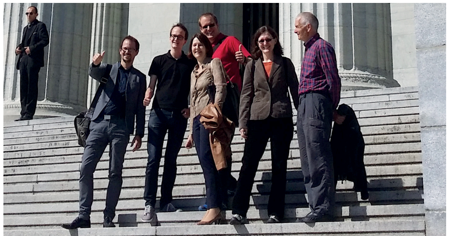
Freude herrscht! Die Delegation der Zürcher Grünen vorm Bundesgericht in Lausanne.

Das Bundesgericht hat unsere Stimmrechtsbeschwerde 5:0 gutgeheissen. Dieses deutliche Urteil zeigt, dass unser Gang ans Bundesgericht gerechtfertigt war. Für die Kulturlandinitiative ist dies ein Meilenstein und für uns ein wichtiger Erfolg im Wahljahr. Mit dem Urteil bestätigt das Bundesgericht nicht nur die inhaltliche Nichtumset-