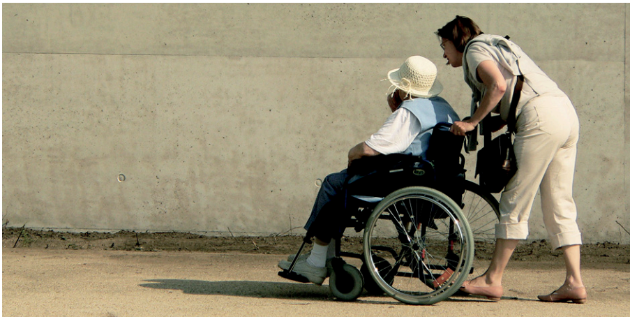
Ein guter Service Public sorgt für hohe Lebensqualität und darf nicht dem globalen Markt geopfert werden.

Die bürgerliche Steuersenkungspolitik höhlt den öffentlichen Haushalt in Milliardenhöhe aus – viele Kantone und Städte sind dadurch in finanzielle