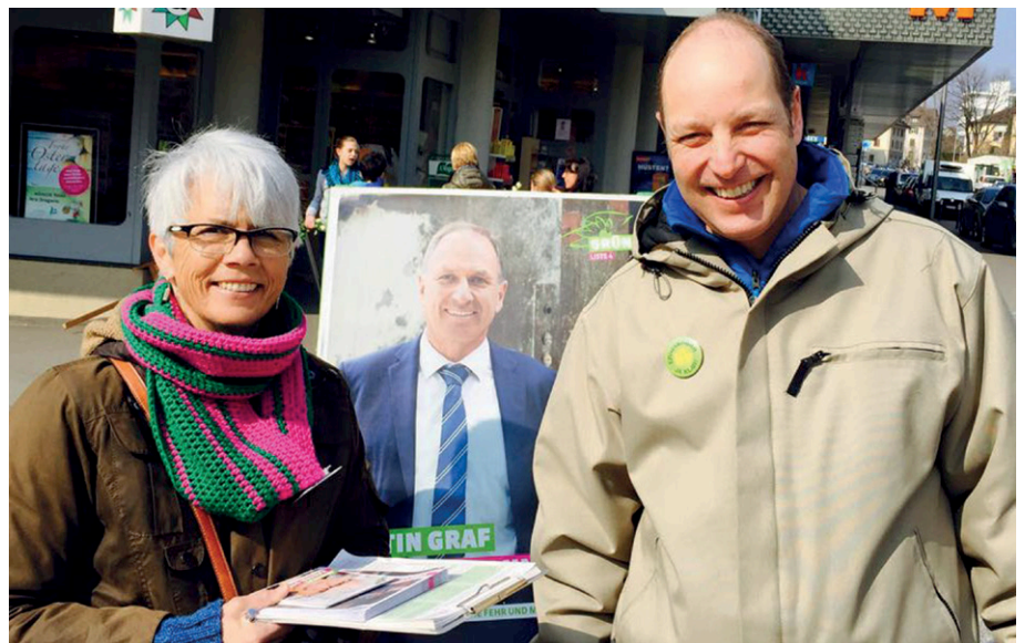
Unser Wahlkampf im Kanton war aktiv! Z.B. in Bülach...

Unsere WählerInnenstärke hat um 3.35% abgenommen und liegt jetzt bei 7.22%. Damit sind wir knapp hinter die