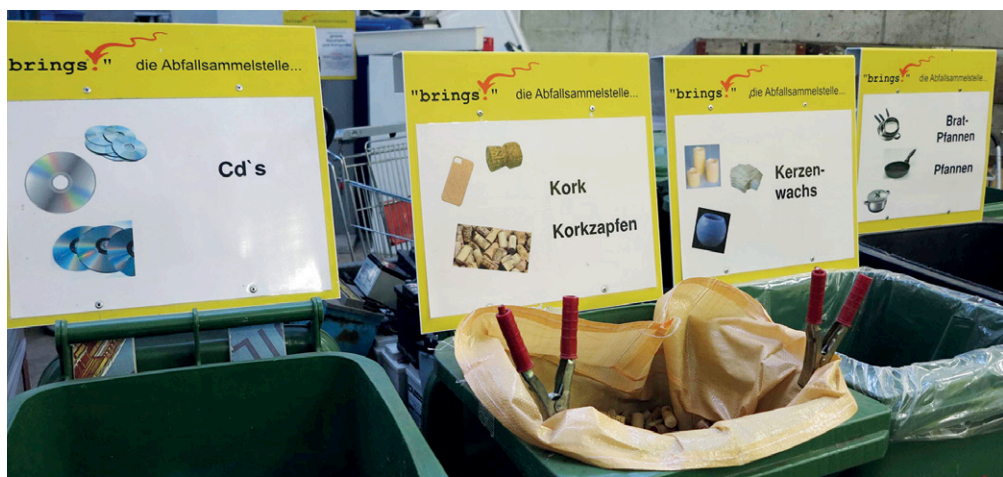
Sinnvoll Wertstoffe sammeln: Alles wird lokal weiterverarbeitet. Hier: Wertstoffsammelstelle der Keller Recycling AG, Hinwil.