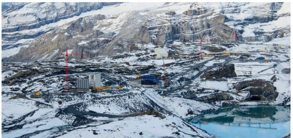
Axpo-Baustelle am Muttsee GL

Axpo-Arbeitsgruppe der Grünen Kantonalparteien